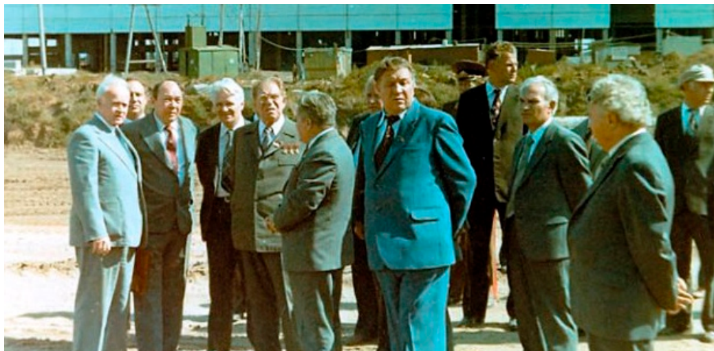
Д. Ф. Устинов на УАПК, август 1983 г.

В память об Устинове в Ульяновске есть проспект Маршала Устинова в Заволжском районе города.